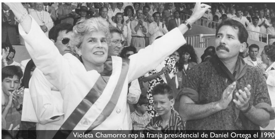
Violeta Chamorro rep la franja presidencial de Daniel Ortega el 1990