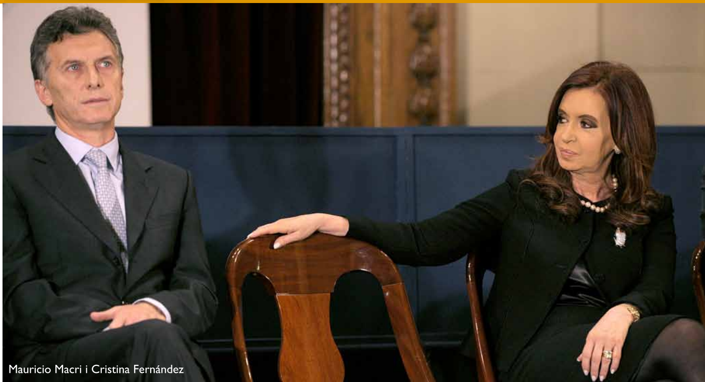
Mauricio Macri i Cristina Fernández

La “grieta” es el significante utilizado coloquialmente para condensar la división de los argentinos entre Kirchneristas y antikirchneristas o populistas y antipopulistas.