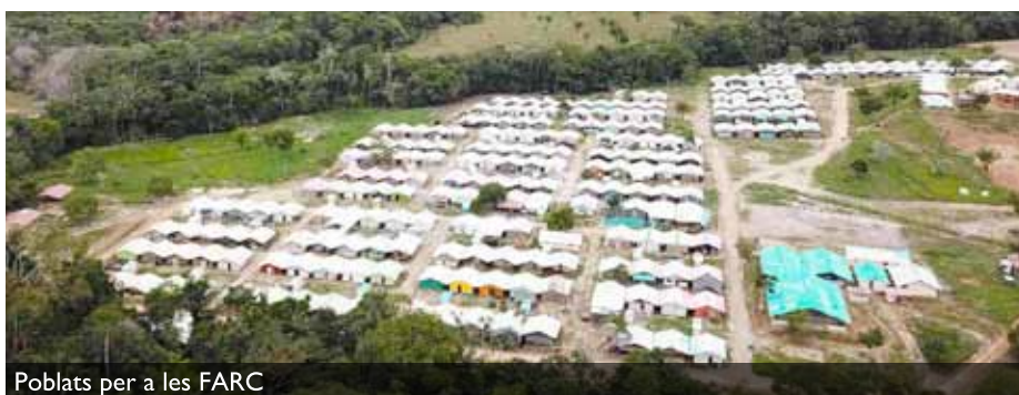
Poblats per a les FARC

El panorama para los próximos cuatro años no es esperanzador, especialmente en un momento en el que el péndulo de la historia en América Latina vuelve a girar hacia la derecha. Es de esperar que las formas de organización y resistencia de los colombianos y colombianas permitan que el pleno goce de los derechos humanos sea una realidad en el país.