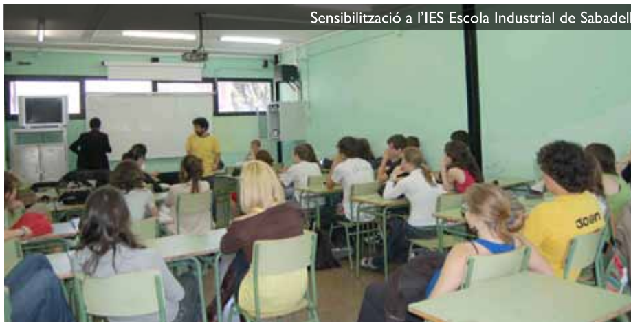
Sensibilización a l'IES Escola Industrial de Sabadell

Olga: Estamos hablando de unos barrios periféricos con muchos problemas sociales, económicos y de todo tipo. Y si no participan los padres de familia y los mismos profesores no toman conciencia de cómo hay que hacer el trabajo con los jóvenes, de cómo se hace el trabajo de la construcción de paz en sí mismo, porque las violencias que se dan son a todos los niveles, entonces no se haría un proceso ni nada. Y, por ejemplo, en el colegio Japón donde ya estamos en el cuarto año, son los mismos estudiantes los que lo piden,