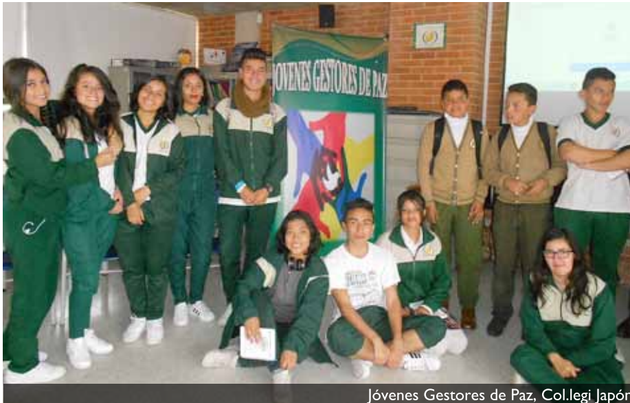
Jóvenes Gestores de Paz, Col.legi Japón

samente el antropólogo del primer proyecto de intercambio con la escuela de Cartagena de Indias sale de un contacto que ella me pasó, así como otros que siguieron.