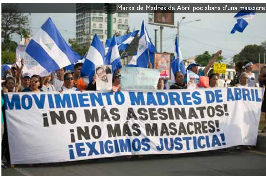
Marxa de Madres de Abril poc abans d'una massacre

Al capdavant, els grans beneficiaris de la tragèdia nicaragüenca seran els sectors més conservadors de la societat, encapçalats per l'activisme del COSEP i de l'Església catòlica, que seran, ben segur i més endavant, els que assumiran les regnes del país amb l'entusiasme vistiplau de l'ambaixada nord-americana. No hi ha res més decebedor, des del punt de vista de l'esquerra, que el pobrerio demanant el lideratge i la intercessió dels podridament rics. És el que passa ara.