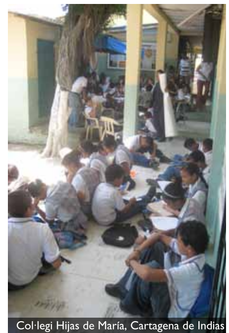
Col.legi Hijas de María, Cartagena de Indias

de trabajar con la juventud y el año pasado iniciamos un proyecto de construcción de paz en un colegio del barrio histórico de la Candelaria de Bogotá, a la vez que manteníamos otro proyecto de los dos que iniciamos con la anterior compañera en el colegio Japón del barrio Kennedy, también de la capital. El colegio de la Candelaria tiene la particularidad de que es un colegio público, pero que además recibe todo el alumnado expulsado de otros colegios. Ahí hay hijos de trabajadoras sexuales o de ladrones, de vendedores ambulantes, es decir de la población que ocupa el escalón más bajo de esa división clasista que existe en Colombia. Dos ejemplos del alumnado: en este curso hay una muchacha, que ojalá pueda acabar el bachillerato, hija de una familia que vive en un barrio cercano a la Candelaria, un barrio extramuros de Bogotá, y en ese barrio viven puros hampones, ladrones y de todo. Esa muchacha pertenece a una familia que toda la generación han sido ladrones: lo abuelos, el papá, los bisabuelos y ella misma. La familia la iba a sacar del colegio para ponerla a trabajar, es decir, "váyase a robar". Y el rector ha ido y lo ha frenado. Hay otro muchacho que el año pasado diseñó el pendón en el que aparecen las colaboraciones del Ayuntamiento de Sabadell y de las entidades que participan. Este chico es un diseñador nato. Está pagando casa por cárcel y va al colegio.