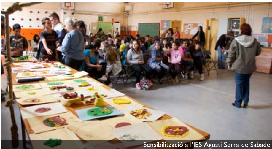
Sensibilització a l'IES Agustí Serra de Sabadell