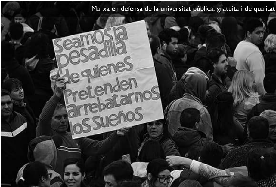
Marxa en defensa de la universitat p3blica, gratuïta i de qualitat

El final anunciado tuvo como protagonista a la clase media que en 2001 se sumó a los sectores más desfavorecidos para visibilizar la pobreza y poner en agenda los temas excluidos durante años. Las mismas clases medias que habían sostenido el modelo con sus votos.