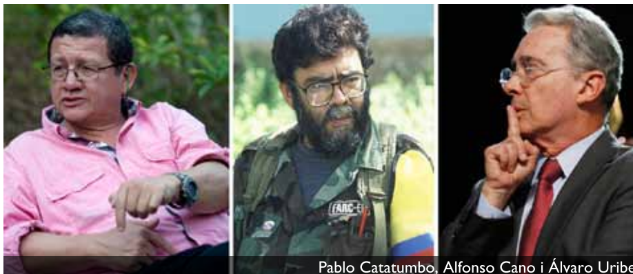
Pablo Catatumbo, Alfonso Cano i 3lvaro Uribe

El acuerdo de paz tiene diversos componentes, que incluyen una transformaci3n del acceso a la tierra -con el fin de hacerlo m3s democr3tico; una mirada 3tnica territorial; una cierta perspectiva de g3nero -que se vio disminuida con el segun-