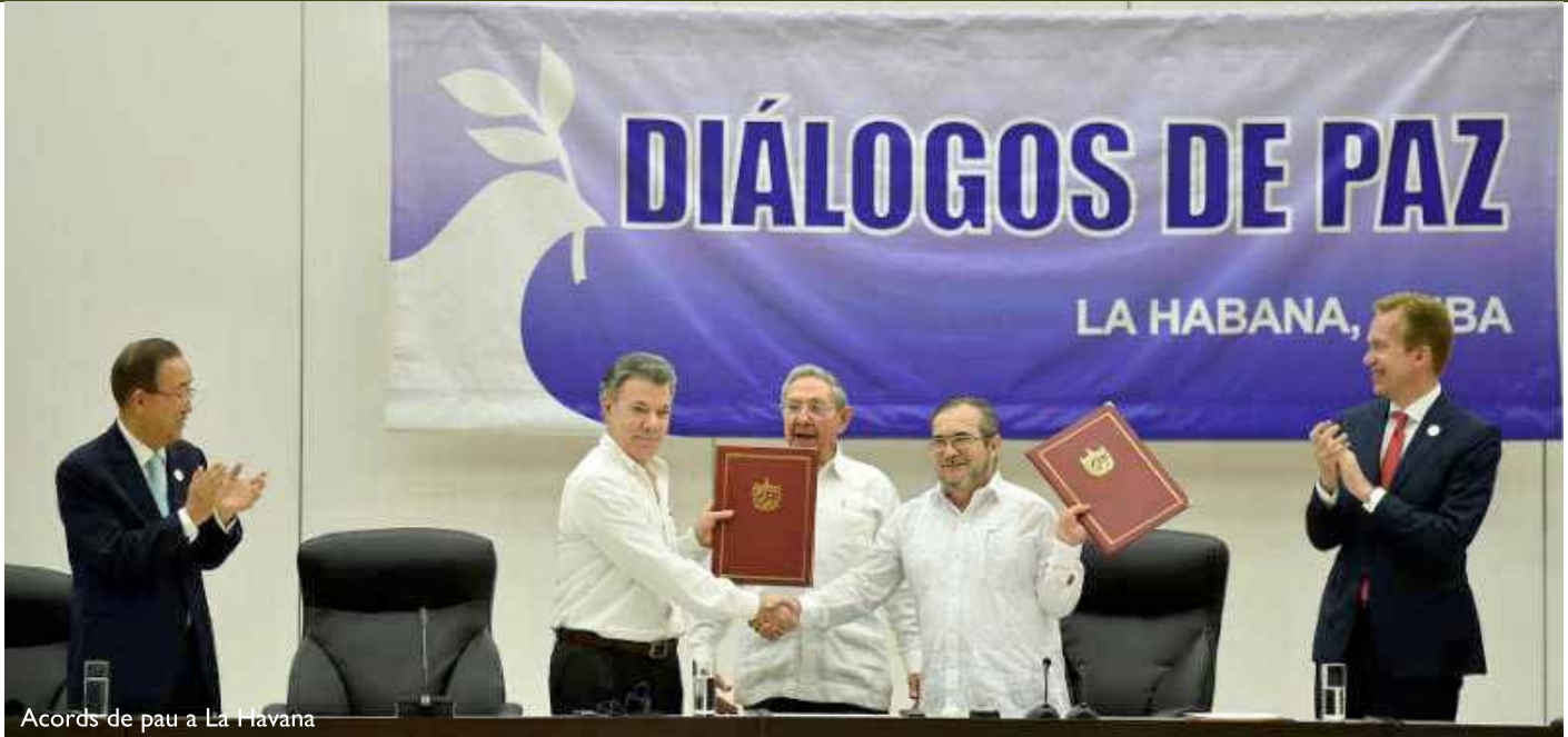
Acords de pau a La Habana

professor associat membre del Grup d'Investigació GLOBALCODES a la Facultat de Comunicació i Relacions Internacionals de la Universitat Ramon Llull - Blanquerna faridsamirbv@blanquerna.url.edu