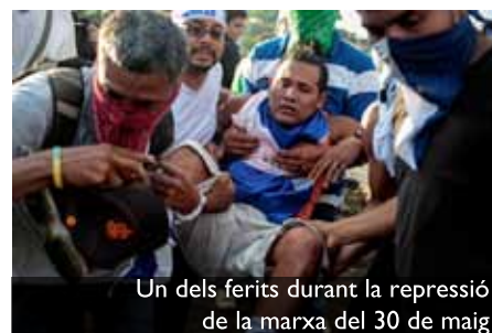
Un dels ferits durant la repressió de la marxa del 30 de maig

L’oposició de sectors camperols —en algun moment bastió del sandinisme— i ecologistes ja s’havia viscut uns anys abans, el 2015, amb la fallida construcció del canal interoceànic. L’Assemblea Nacional havia votat majoritàriament una llei que atorgava al consorci xinès