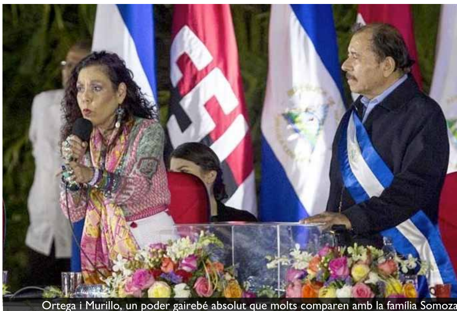
Ortega i Murillo, un poder gairebé absolut que molts comparen amb la família Somoza