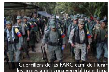
Guerrillers de las FARC camí de lliurar les armes a una zona veredal transitòria

En este contexto llega Uribe Vélez a la presidencia, con un discurso simple de promesa de derrotar militarmente a las guerrillas, el cual atraía a las masas conservadoras